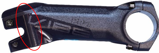
Gambar 2: Retakan dapat terjadi di dalam daerah penjepit tabung fork steerer.

Korosi dapat menyebabkan retakan yang terbentuk di dalam daerah penjepit tabung fork steerer (seperti yang ditandai pada Gambar 2).