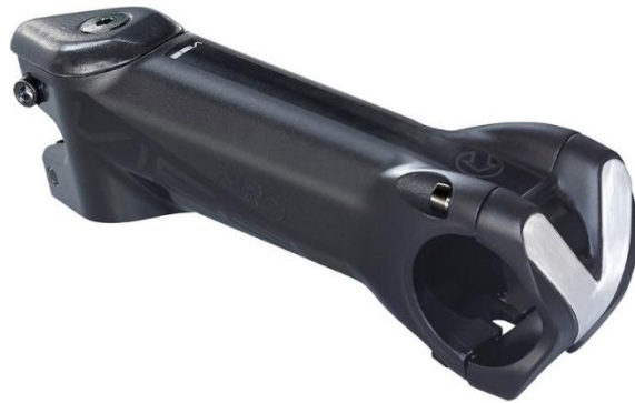
Gambar 1: PRO Vibe Stem (Alloy) yang masuk dalam penarikan.